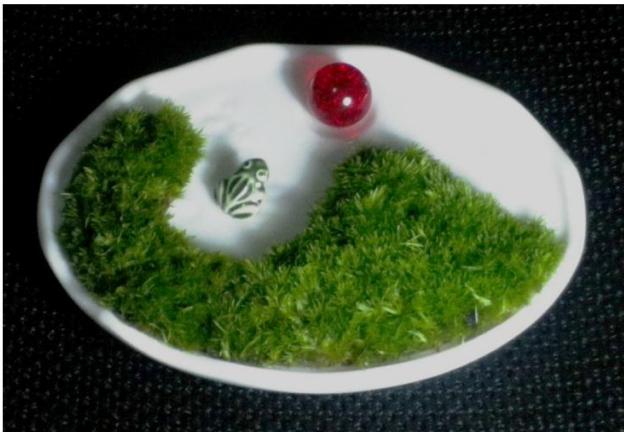
フジ：苔部11cmの浪裏富士造形、醤油絵皿(富士)鉢、ビー玉・蛙飾り