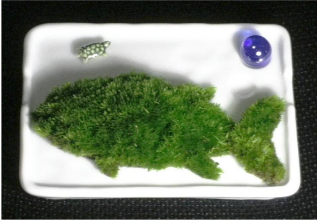
マグロ：苔部12cmのマグロ造形、醤油絵皿(鯛)鉢、ビー玉・亀飾り

「モス盆栽」は、コケ(主に細葉オキナ苔)の一株を植物の有機的最小単位(数mm)として、瀬戸焼(流体力学による給水性能と絵柄造形の水溜めを備える醤油絵皿など)や美濃焼(緑釉が融合する織部焼など)を活用した鉢の上に、特殊な用土と共に様々なデザインに精密造形した、コケが主役の苔盆栽であり(岩田種苗店と共同開発)、動植物や地形等のモチーフをカワイイ苔並で表現したモスボン(愛称)を室内で育成しながら愛でられます。 www.mosbonsai.com 2014年1月14日 ファンタステキ 岩田 賢