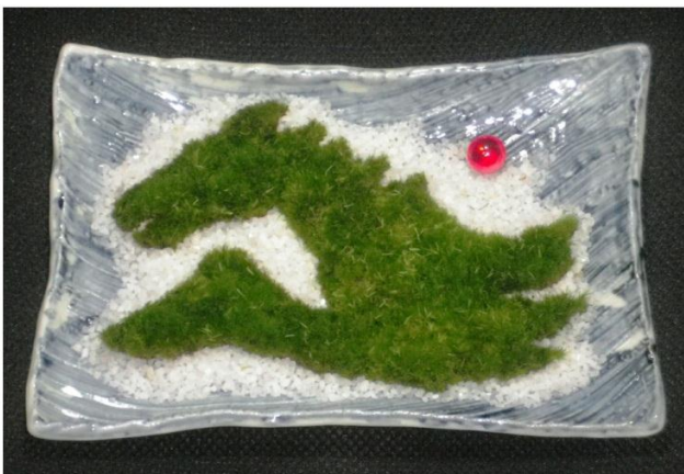
天馬富士：苔部20cmの富士を駆ける天馬造形、美濃焼鉢、大理石の空