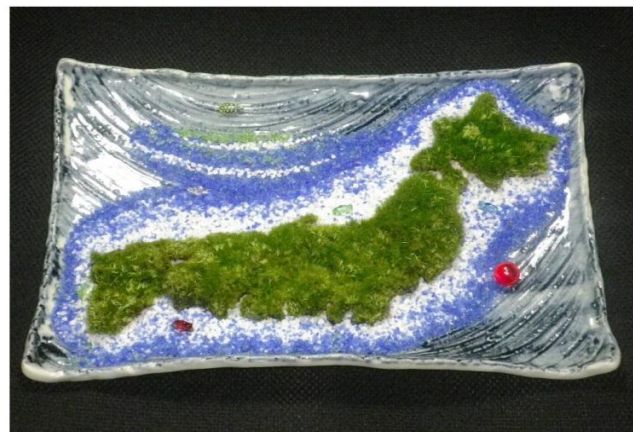
苔のモスまで日本：苔部34cmの日本地図造形、美濃焼鉢、ガラスの海