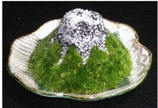
風水フジ：苔部φ11cmの八卦富士造形、織部焼(小)鉢、大理石の雪